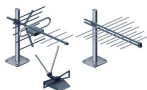
Дециметровая или всеволновая антенна