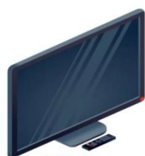
схема А Современный телевизор DVB-T2 видеокодек MPEG-4 режим Multiple PLP