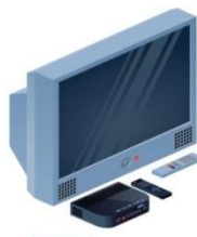
схема Б Телевизор + цифровая приставка DVB-T2 видеокодек MPEG-4 режим Multiple PLP